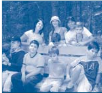
Moment de repos après une grande excursion