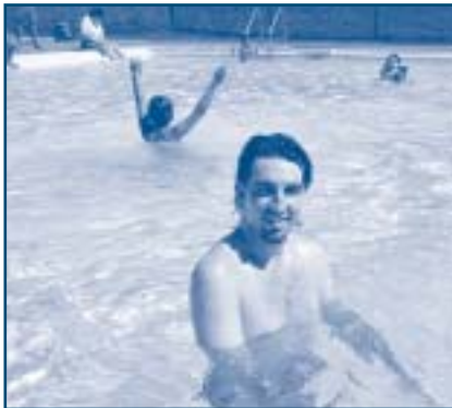
Un bon moment pour se rafraîchir