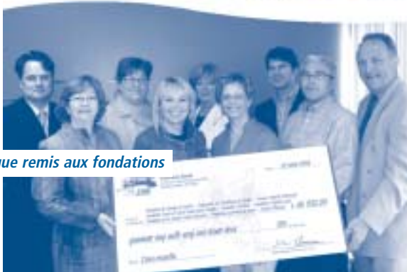
Le chèque remis aux fondations