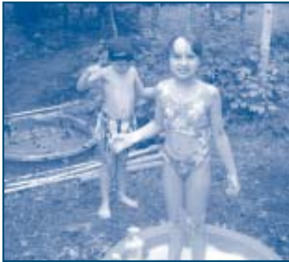
Entre frère et sœur : une activité de piscine